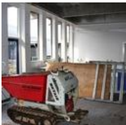
Som det ses, blev der gået grundigt til værks

Der er de seneste år sket meget på det bygningsmæssige område på skolen: Musikhus, bogligt hus, hal og administrationsafsnit og processen med at modernisere skolen fortsætter. Da vi mødte efter sommerferien 2010 var det første syn, der mødte os, en totalrenoveret centralgarderobe med mere arbejdsvenlige møbler. Som led i skolens øgede fokus på naturvidenskab blev hele det naturvidenskabelig afsnit ombygget totalt i løbet af skoleåret og sommerferien – det fremstår her i august 2011 som en helt ny skole med undervisningsvenlige lokaler og elevarbejdspladser: