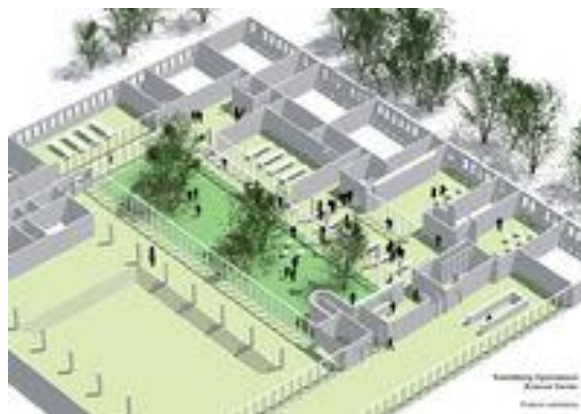
Oversigtsplan for ombygningen

Og arbejdet med de næste ombygninger er gået i gang: Bedre elevfaciliteter i kælderen, og planerne for skoleåret 2011-2012 er udvidelse af elevkantinen, flytning af biblioteket og udvidelse af administrationsafsnit, lærerværelse og etablering af flere lærerarbejdspladser.