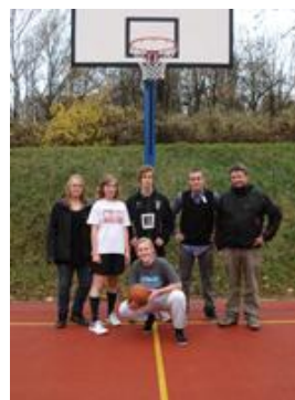
SG-elever i Prag - efter at have vundet en basket-turnering