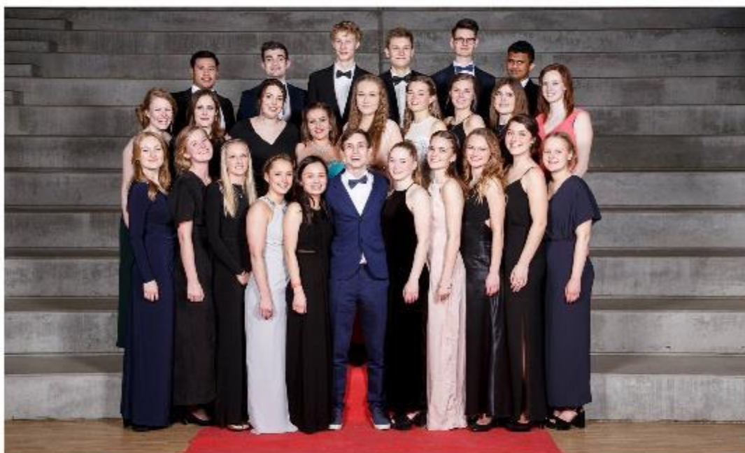
3X GALLA · 2015-2016