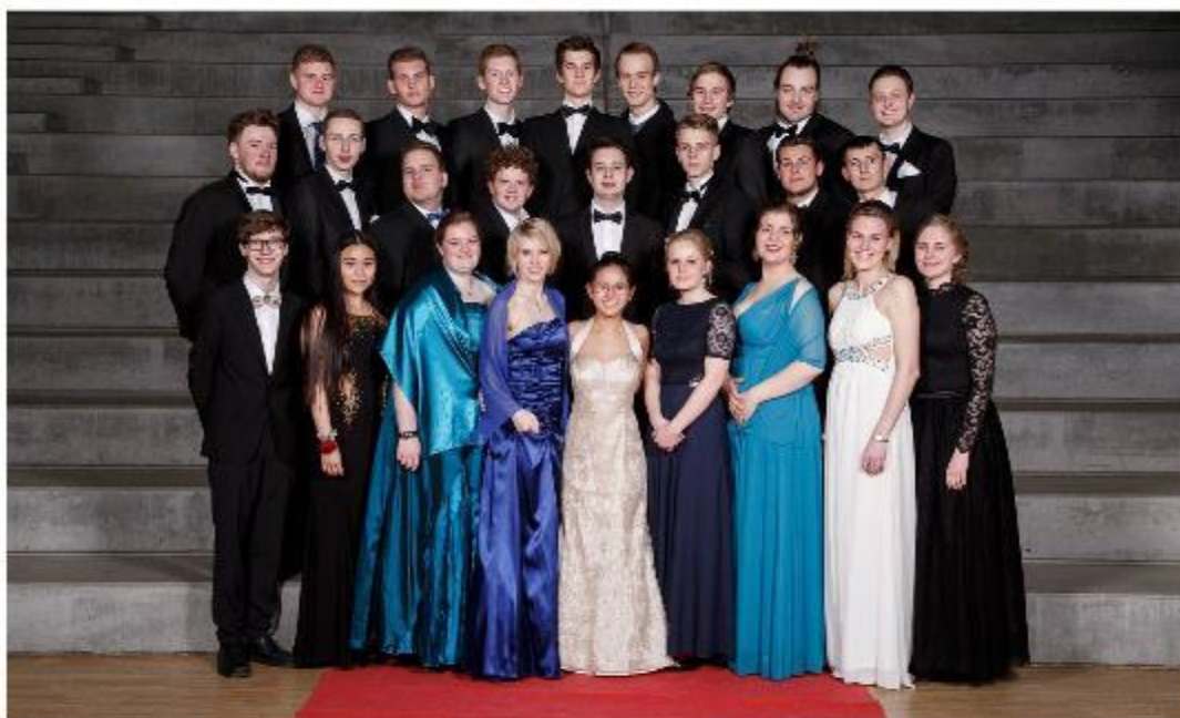
3Z GALLA · 2015-2016