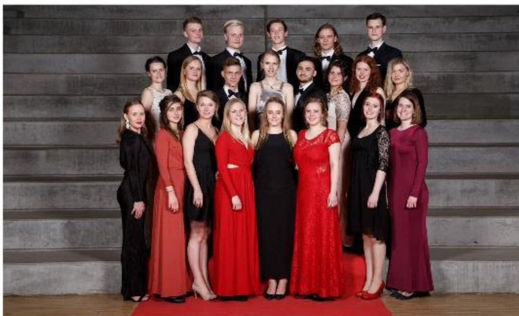
3E GALLA · 2015-2016