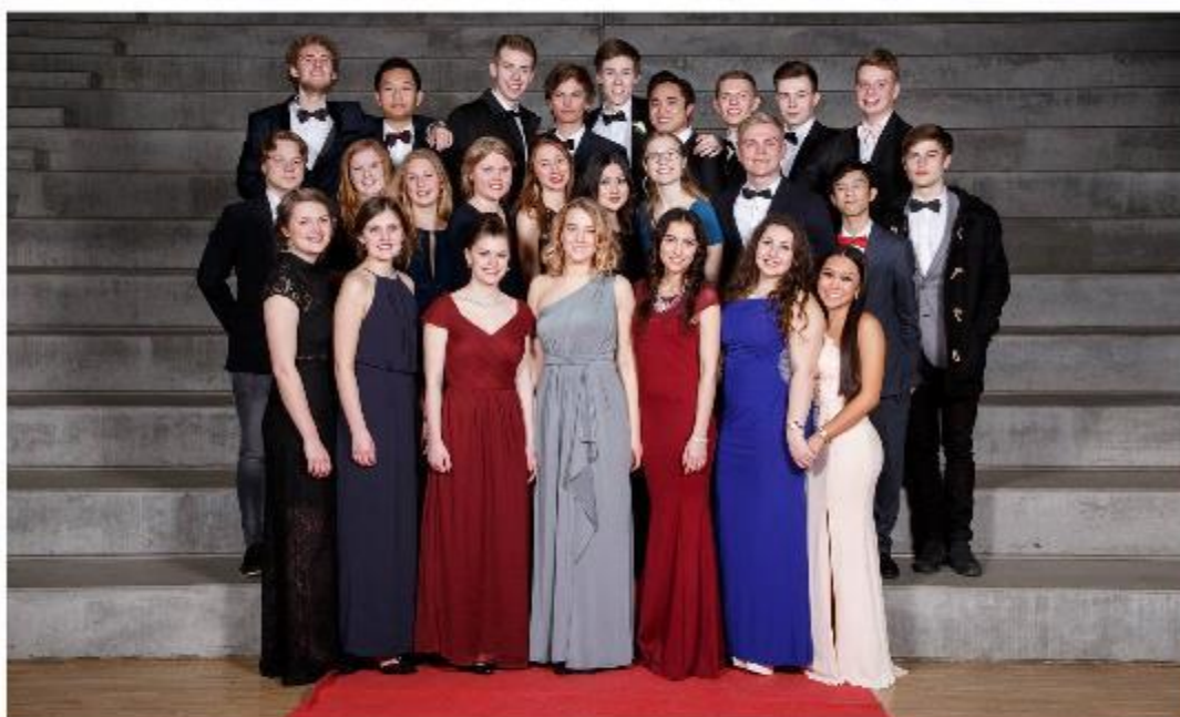
3Y GALLA · 2015-2016