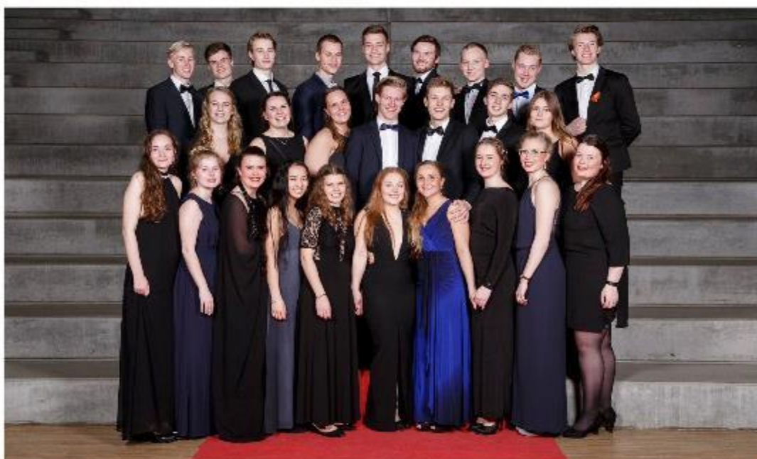
3T GALLA · 2015-2016