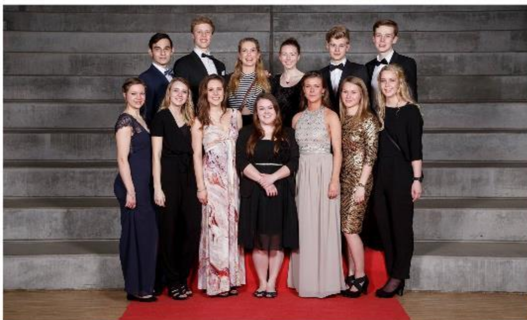
3S GALLA · 2015-2016