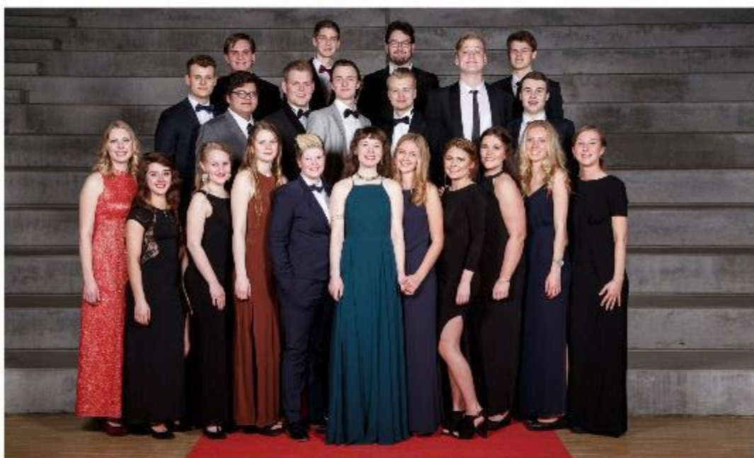
3M GALLA · 2015-2016