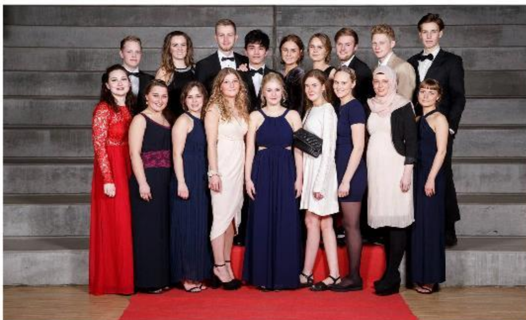
3C GALLA · 2015-2016