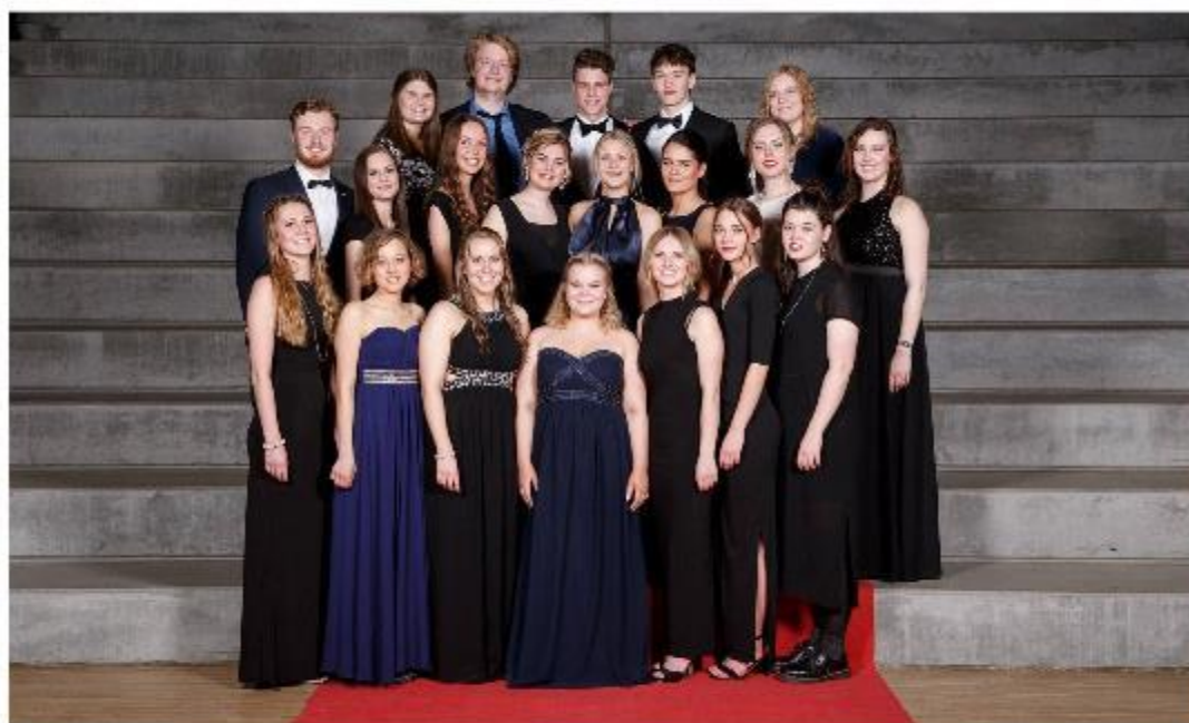
3A GALLA · 2015-2016