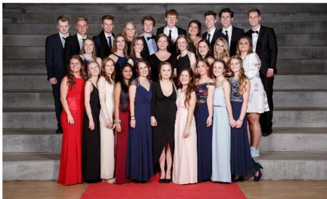
3B GALLA · 2015-2016