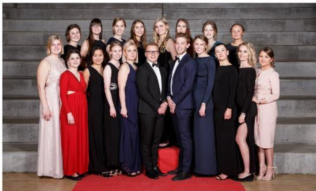
3U GALLA · 2015-2016