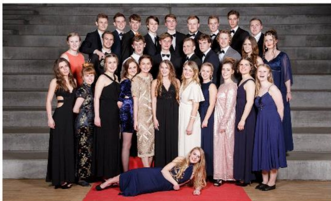
3V GALLA · 2015-2016