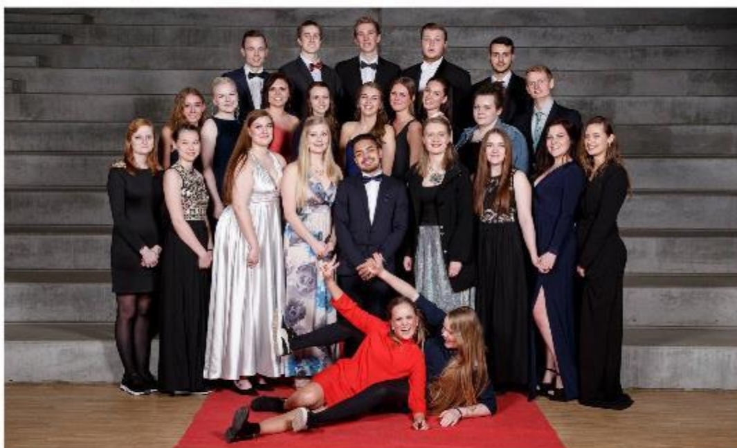
2P + 2Q GALLA · 2015-2016