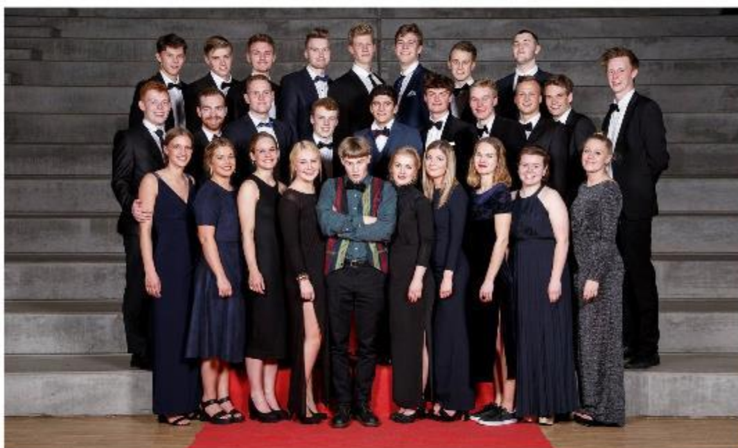
3D GALLA · 2015-2016